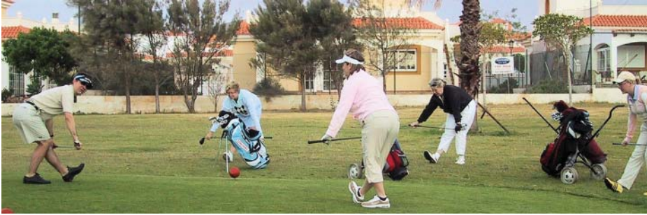
Kuvat ja teksti: Riitta Ekman