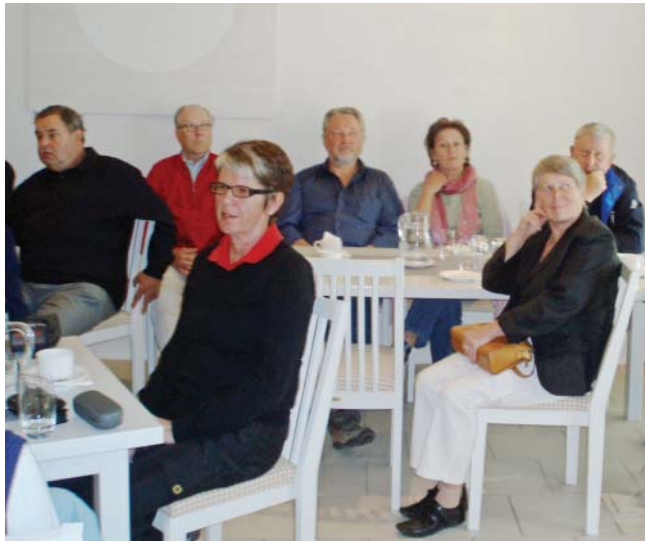
Senioreiden avausilta toukuussa 2007

Viime kauden kiinnostavimpia tapahtumia olivat osanottajilla mitattuna meidän ja lähialueiden senioritoimikuntien edustajien vierailut toistensa kentille, senioreiden kuukausikilpailu ja kotimaan golfmatka. Unohtaa ei myöskään sovi hupimielessä pidettyä leikkikisaa.